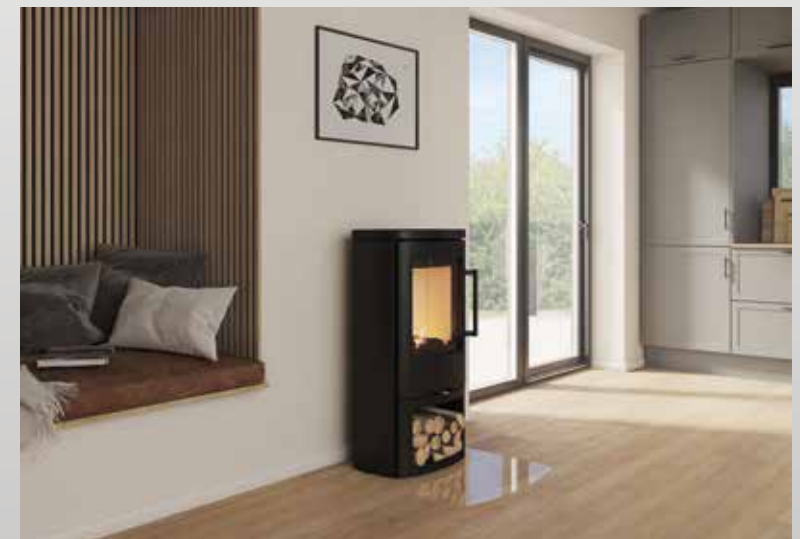
Feurige Highlights: Trends & Neuheiten